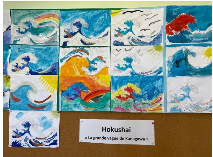
Hokusai « La grande vague de Kanagawa »