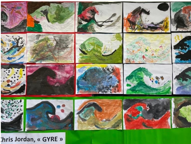
Chris Jordan, « GYRE »